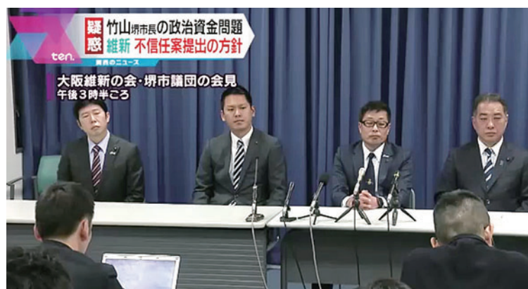
大阪維新の会堺市議会議員団 副幹事長として記者会見に同席 読売テレビ2月21日放送「ten」より

まだ予断は許しませんが、大阪維新の会堺市議会議員団は更なる市政改革、そしてこれまでもこれからも『身を切る改革』を進めてまいります。