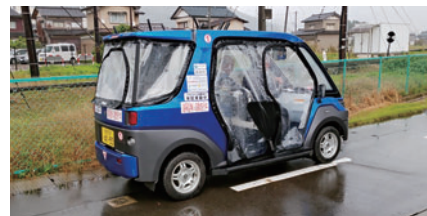
国が行う自動運転の実証実験（福井県永平寺町）